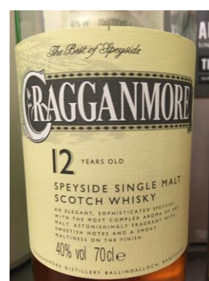
Nr.2 Cragganmore 12 år 40%