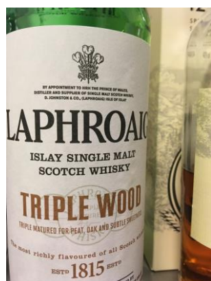
Nr.3 Laphroaig Triple Wood 3 fade 48%