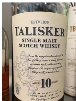
Nr.4 Talisker 10 år 46%