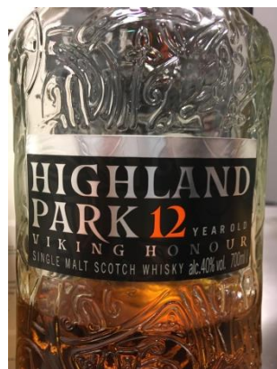
Nr.6 Highland Park 12 år 40%