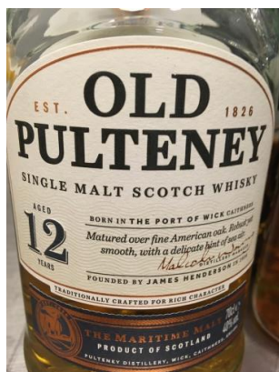
Nr.7 Old Pulteney 12 år 40%

Kåret ved blindsmagning 31. januar 2020 i Nyborg Whisky Club